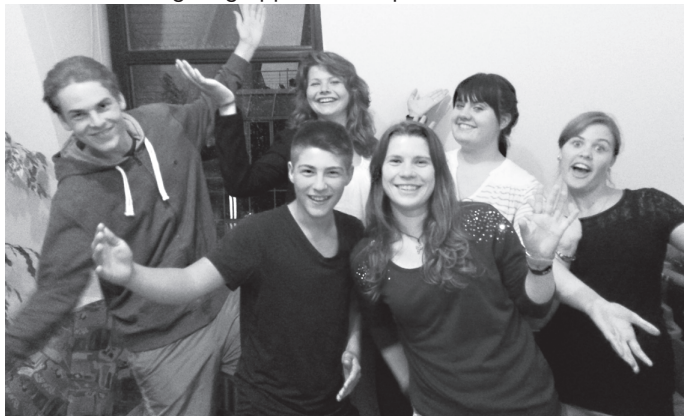
Jugendliche aus dem „Arbeitskreis Asaroka“